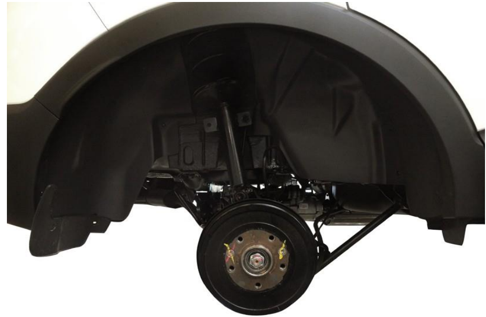
Колесная арка с установленной защитой

В зимний период года установленные подкрылки препятствуют налипанию снега в колесной арке и защищают колесные арки автомобиля от негативного воздействия химических реагентов с дорожного полотна.